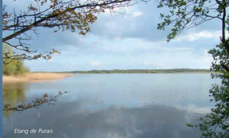
Etang de Purais