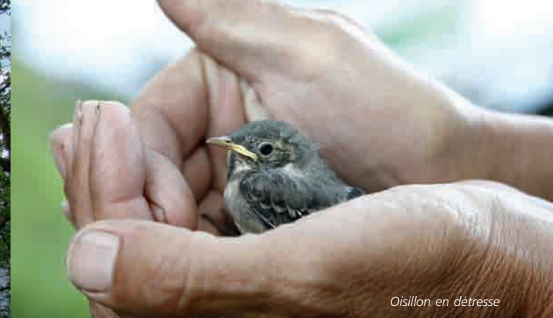
Oisillon en détresse