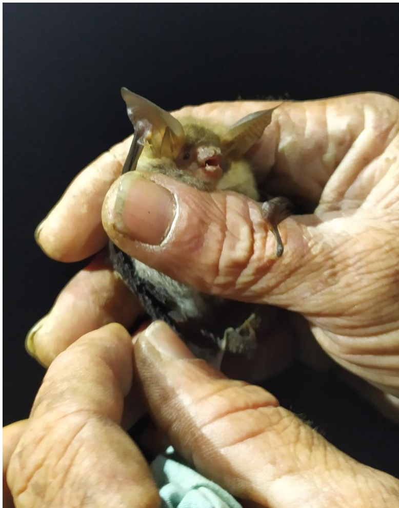
Murin de Bechstein