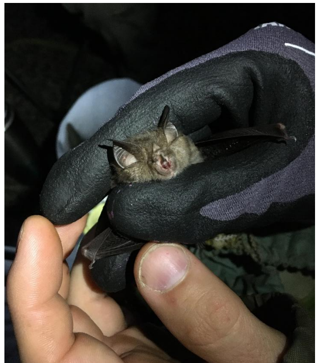
Petit rhinolophe