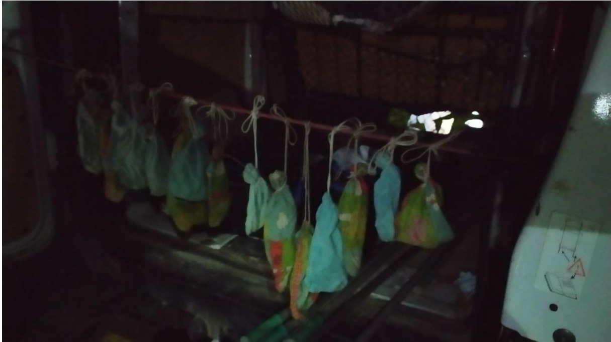
Brochette de pochons.

En passereaux : le vent de nord n'est pas favorable en principe mais 2 Roitelets triple bandeau se prennent quand même. D'ailleurs le vent nous a fait plier un peu tôt car y avait des filets qui commençaient sérieusement à bouger.