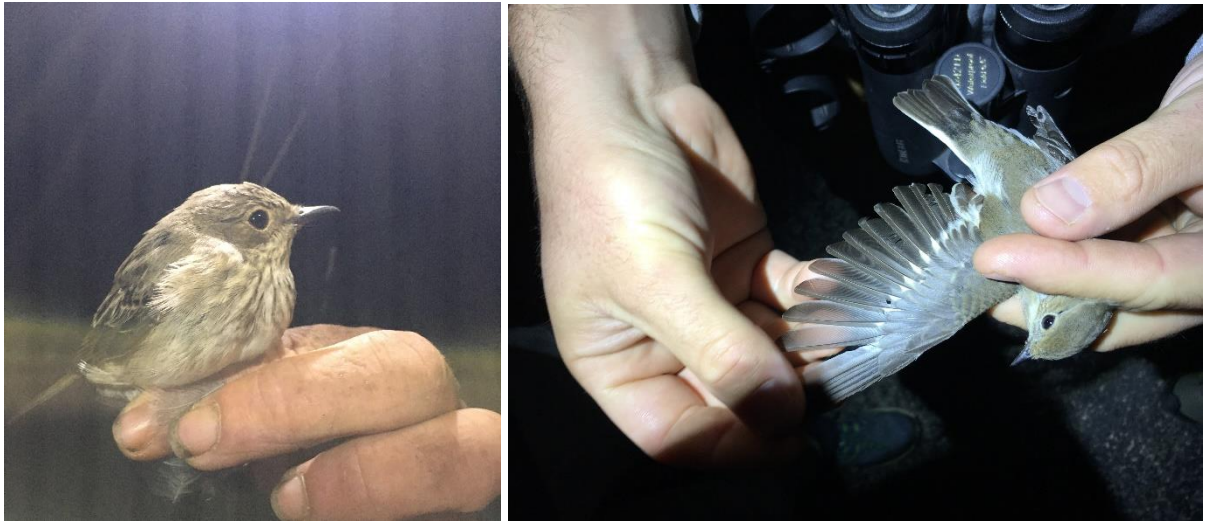
Gobemouche gris (à gauche) et Gobemouche noir.

Tout ça s'est bien sympa mais les troupes commencent sérieusement à s'essouffler alors on décide de plier les gaules à 1h45.