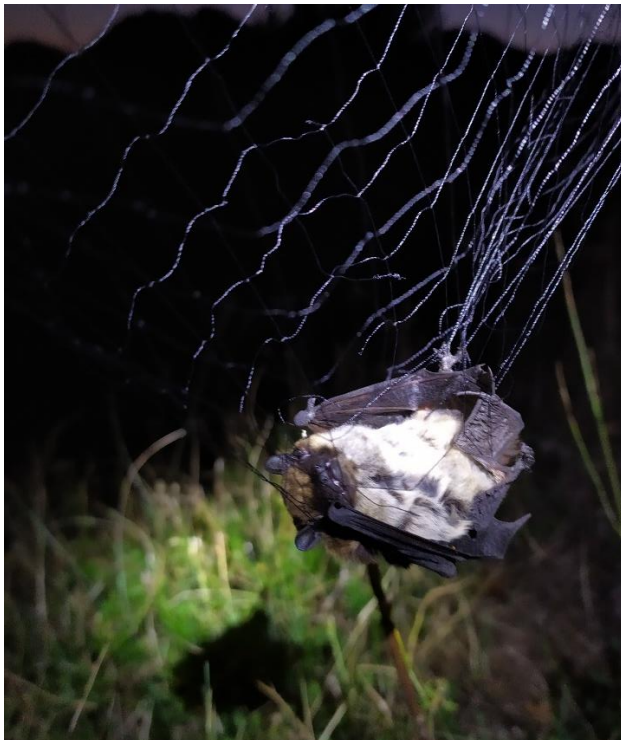
Vespère de Savi dans le filet, photo Guilhem Barneix

En passereaux : le vent de nord n'est pas favorable en principe mais 2 Roitelets triple bandeau se prennent quand même. D'ailleurs le vent nous a fait plier un peu tôt car y avait des filets qui commençaient sérieusement à bouger.